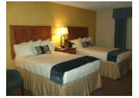
マントホリヨーク大学・キャンパス内ホテル